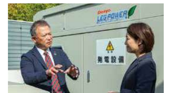
災害用LPガス発電機を導入いただいています。災害時も電力の安定供給が可能に。